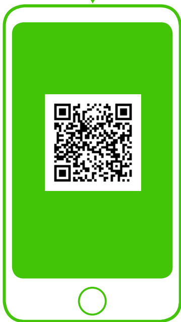
※新型コロナ対策パーソナルサポート (行政) QRコードから登録